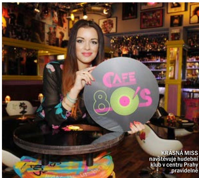
KRÁSNÁ MISS navštěvuje hudební klub v centru Prahy pravidelně