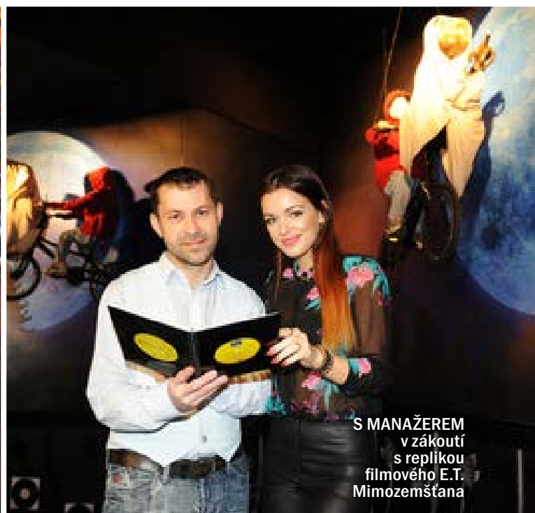
S MANAŽEREM v zákoutí s replikou filmového E.T. Mimosmšťana