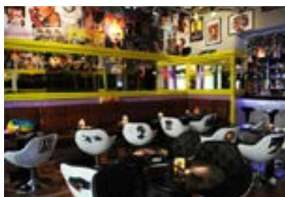
KŘESÍLKA se jmény slavných hvězd